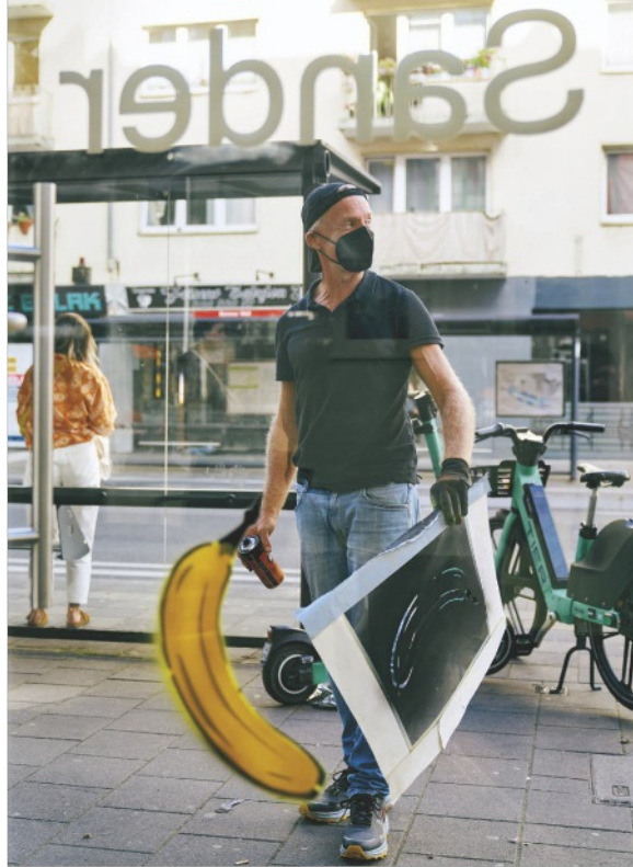
Der Lack ist noch frisch: der Künstler bei der Arbeit vor einer Galerie in Köln