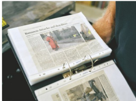
Baumgärtel sammelt jeden Artikel, der über ihn erscheint (unten)

Fleck, wenn ich Kunst ausstelle“, sagt er. Dass die Banane ein Gütesiegel sei, höre er zum ersten Mal.