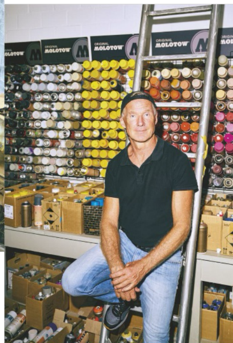
Stets sprühhbereit: der Künstler vor seiner Palette

Einmal landete er im Gefängnis, seine Anzeigen sammelt er