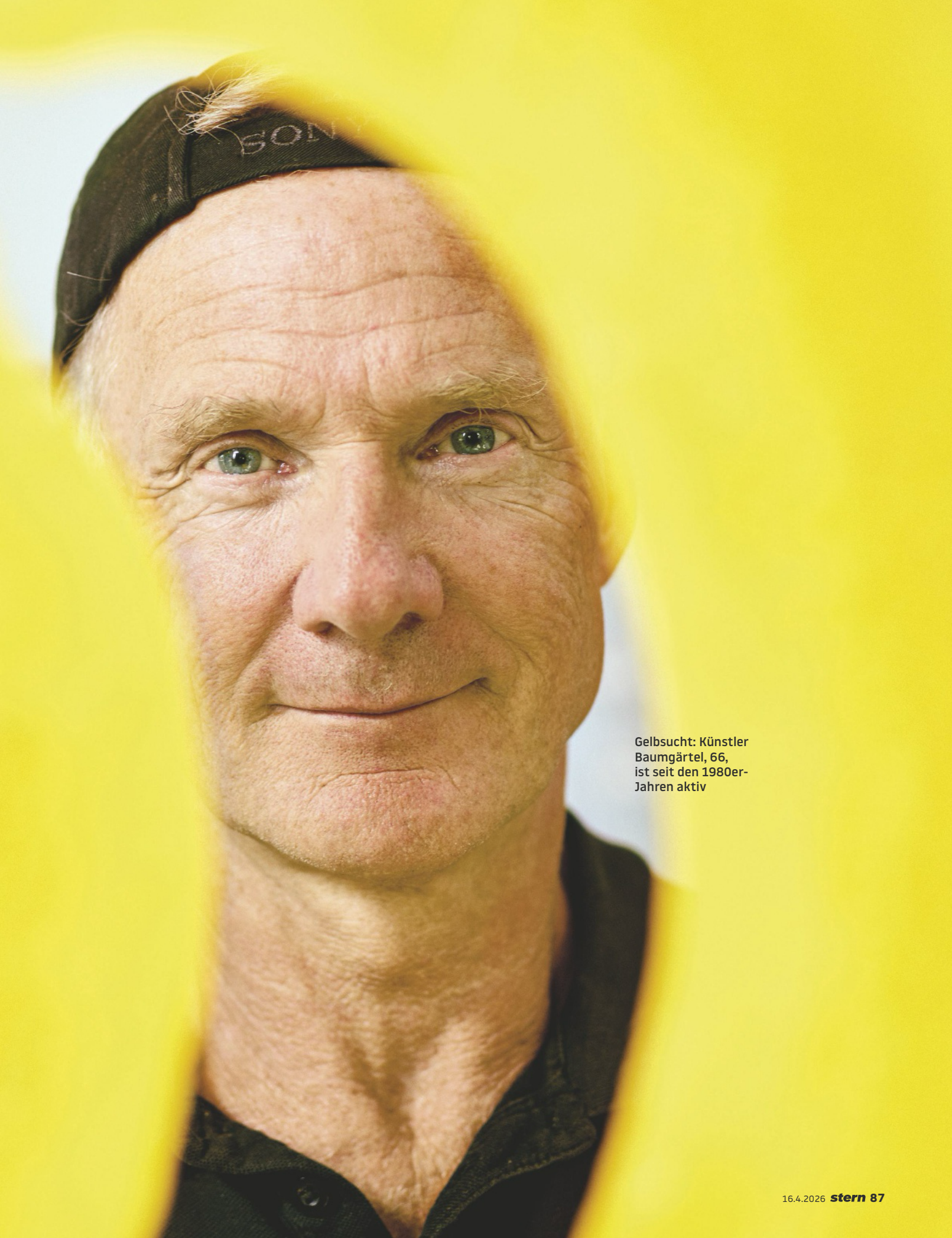
Gelbsucht: Künstler Baumgärtel, 66, ist seit den 1980er-Jahren aktiv